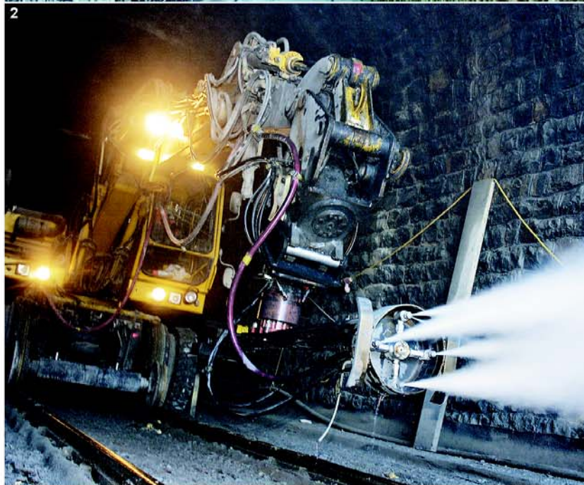
1. Profilaufweitung durch Gewölbeausbruch und Spritzbetonreprofilierung 2. Gewölbereinigung mit Wasserhöchstdruck bis 2'000 bar