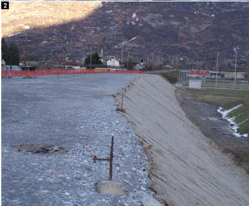
1. Canale scorrimento acque e ponticello stradale 2. Rilevato ATG con innesto a linea esistente