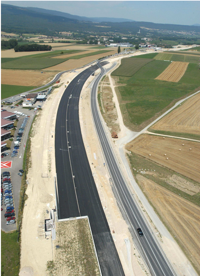
Vue aérienne 2004